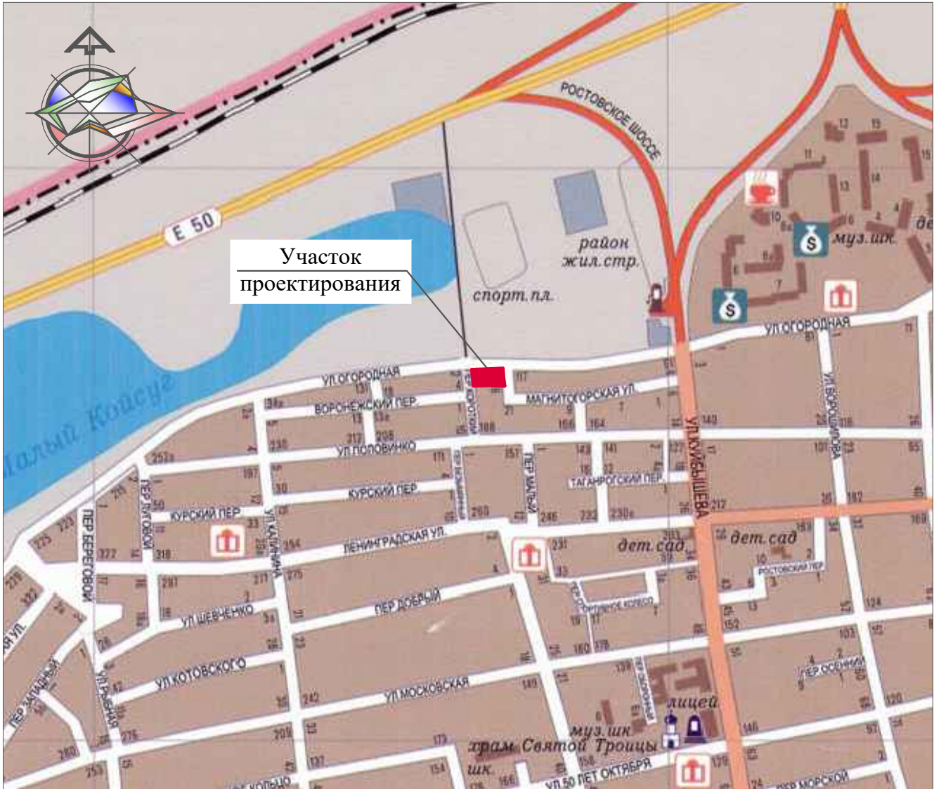
СИТУАЦИОННЫЙ ПЛАН М 1:10000