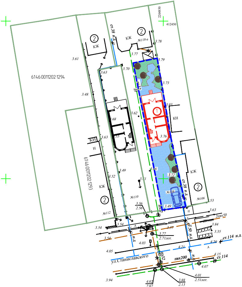
Схема планировочной организации земельного участка (М 1:500)